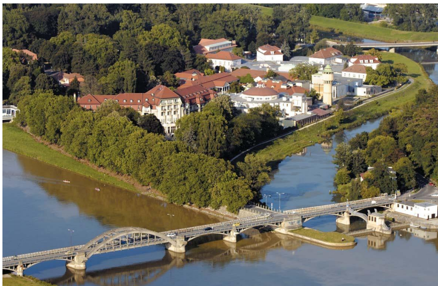
皮耶什佳尼温泉中心

据斯洛伐克统计局数据，按照购买力平价计算，2019年斯洛伐克人均医疗健康支出1600欧元，比欧盟平均水平低40%。根据世界卫生组织2019年公布的数据，斯洛伐克预期平均寿命77.3岁，其中男性73.7岁，女性81.1岁。