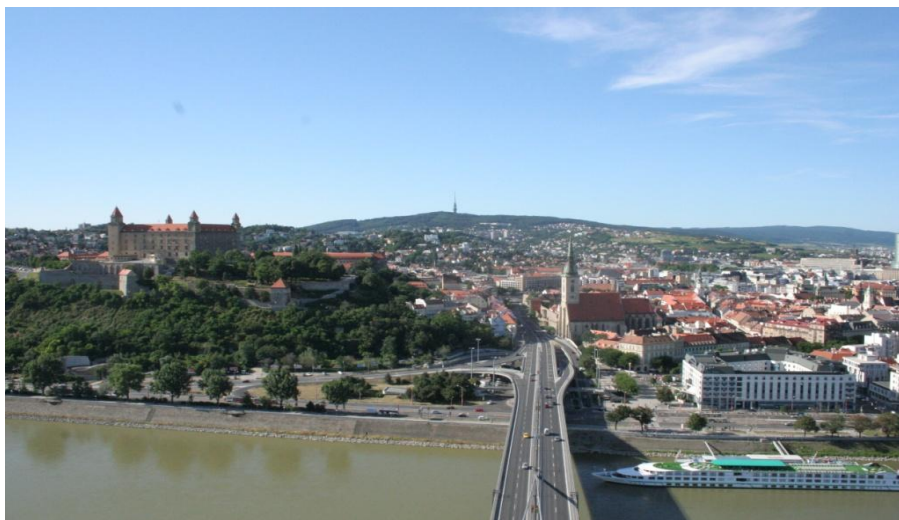
首都布拉迪斯拉发全景