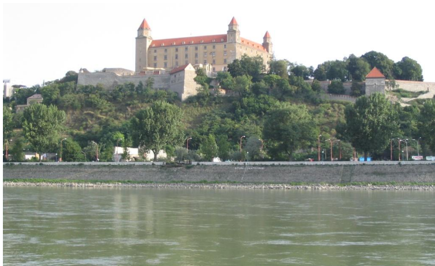
布拉迪斯拉发城堡